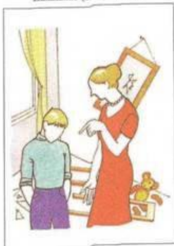
Наказание (стыд — вина)