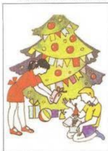
Сюрприз (интерес — удивление)