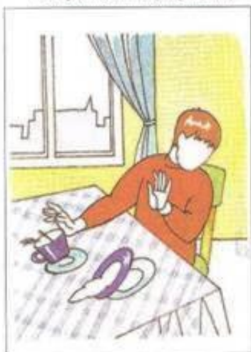
Отвержение пищи (отвращение)